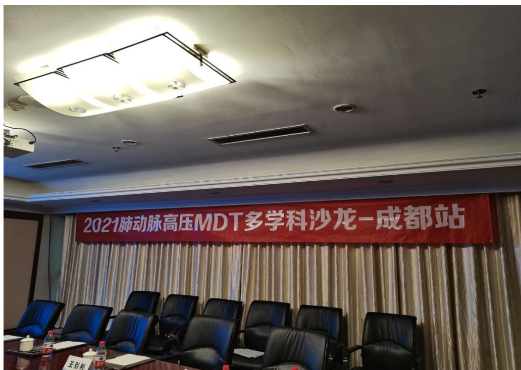
规培学员参加学术交流会议