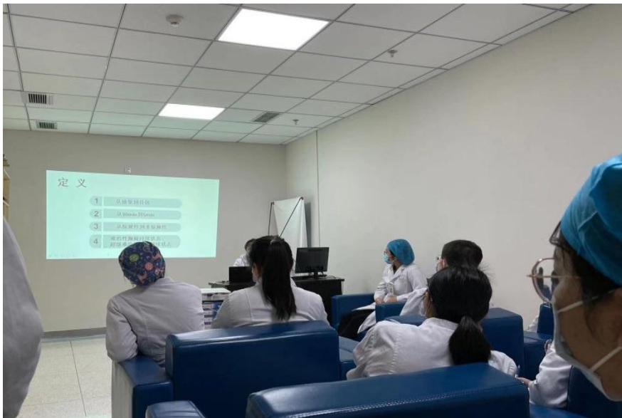
规培学员参加神经内科每周小讲