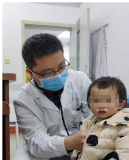
规培学员为患儿做心肺听诊