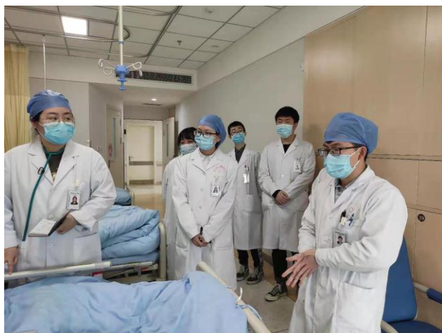
规培学员参加心内科教学查房