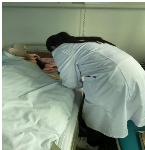
规培学员为病人抽静脉血

做好手卫生，到后面慢慢熟悉流程。老师们在操作过程中耐心细致地讲解解剖结构，以及手术过程每一步操作的意义和下一步安排。科室安排的小讲课，让我对妇产科的相关疾病