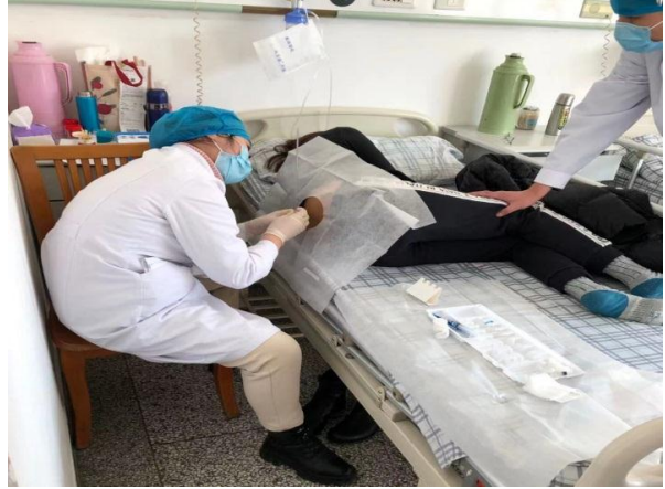
规培学员观摩学习腰椎穿刺术