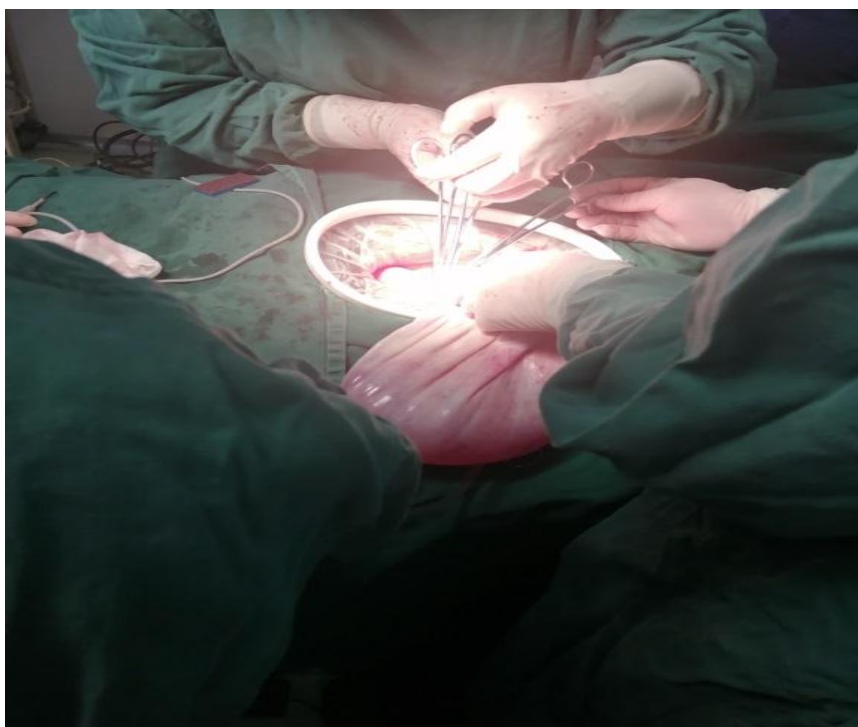
规培学员观摩卵巢囊肿切除手术