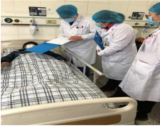
规培学员参加神经内科教学查房讲解