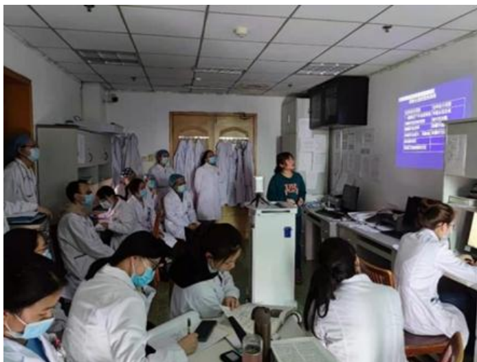
规培学员参加儿科小课堂