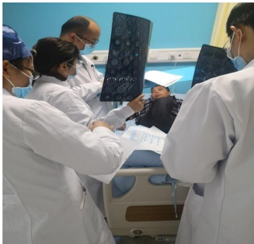
规培学员查房并学习阅片