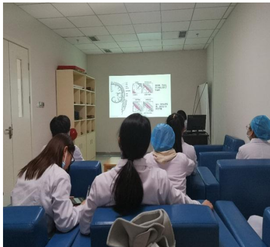
规培学员参加专业知识小讲堂