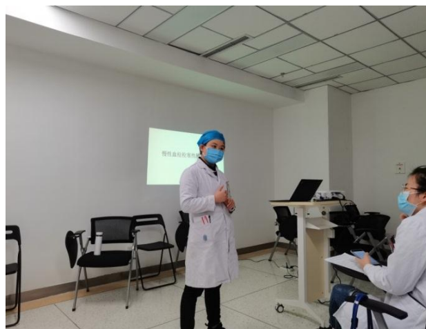
规培学员参加心内二主任教学查房