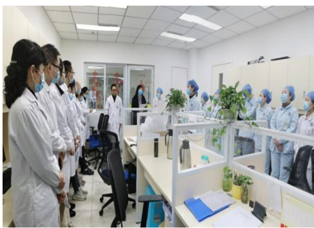
规培学员参与肾内科交班