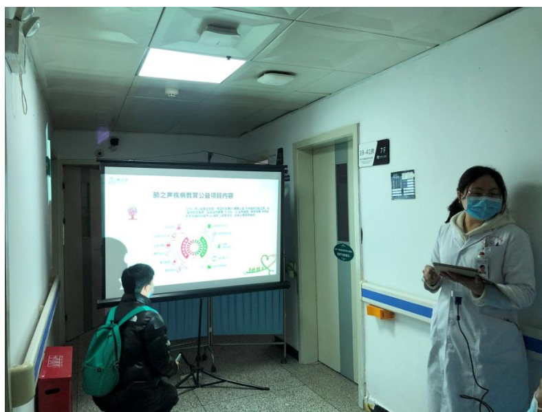
规培学员参加呼吸内科小课堂学习